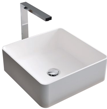
HI-MACS-Mineralwerkstoff ist stark schmutzabweisend und hygienisch; Waschbecken von LG Hausys