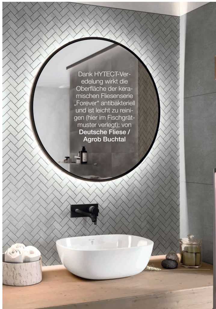
Dank HYTECT-Veredelung wirkt die Oberfläche der keramischen Fliesenserie „Forever“ antibakteriell und ist leicht zu reinigen (hier im Fischgrätmuster verlegt); von Deutsche Fliese / Agrob Buchtal