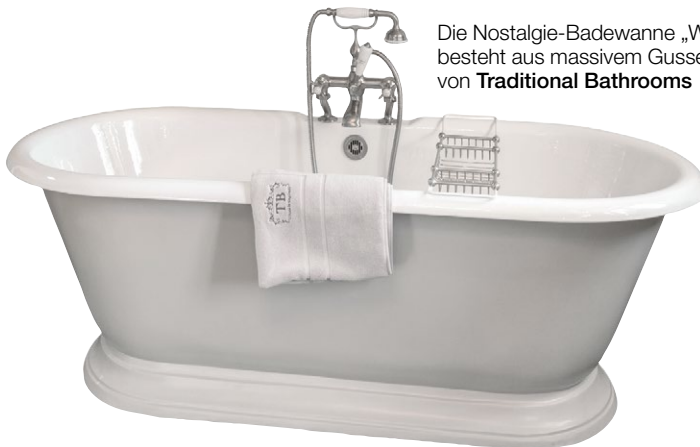
Die Nostalgie-Badewanne „Warwick“ besteht aus massivem Gusseisen; von Traditional Bathrooms

Schadstoffgeprüfte Materialien, hygienische Oberflächen und ein gesundes Raumklima sind auch im Badezimmer von großer Bedeutung. So beugt eine gute Bad-Belüftung ungesunder Schimmelbildung vor, die bereits bei einer Luftfeuchtigkeit von 60% einsetzen kann. Tipp: Für ein Bad ohne Fenster bietet sich ein Entlüfter mit sensorgesteuertem Luftfeuchtigkeits- und Temperaturmesser an.