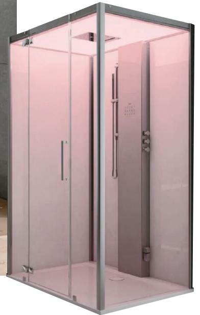
Dampfdusche „Sense-Perience“ mit Farblichtwechsler; von Hoesch