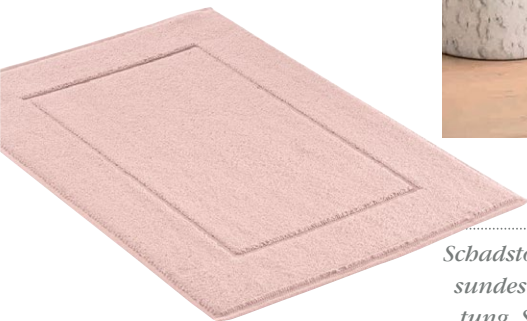
Frottee-Badematte aus Bio-Baumwolle, ohne umweltbelastende optische Aufheller; 31 Euro, von hessnatur