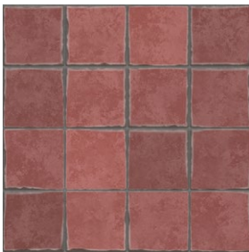
Tipp: Terracotta-Lehmfiesen regulieren die Raumluftfeuchtigkeit.