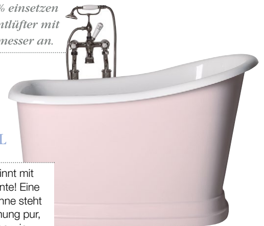
Platzsparende Badewanne „Tubby Torre“ aus Mineralguss; von Traditional Bathrooms

Wohngesundheit beginnt mit einem Wohlfühlambiente! Eine hochwertige Badewanne steht nicht nur für Entspannung pur, sondern mit Materialien wie Gussreisen oder Mineralguss auch für Robustheit und Langlebigkeit. Wellness gepaart mit Qualität und Tradition – das gibt's bei Traditional Bathrooms.